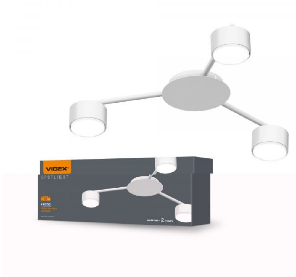
Oprawa sufitowa punktowa