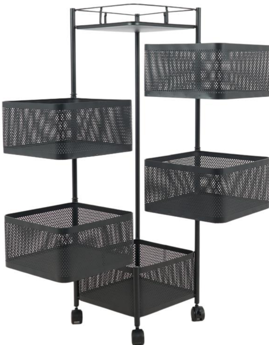
WM90CZ Wózek metal 5 koszy 90cm czarny N