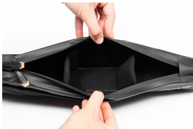
COMPARTI MODULABILI MODULR COMPARTMENTS