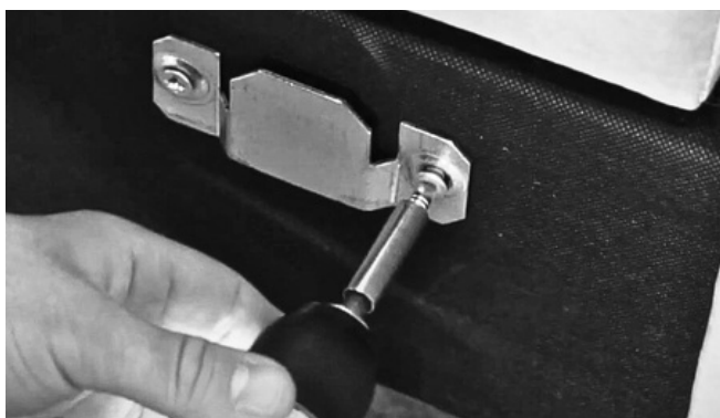
Rys. 1. Odkręcanie szczepów meblarskich wykonać należy z obu stron otomany.