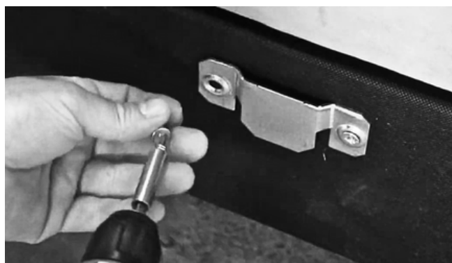
Rys. 2. Ponowne przykręcanie szczepów do otomany wykonać należy w tych samych miejscach, po wcześniejszym ich obróceniu o 180°.

Jeśli poprawnie wykonałeś kroki z punktów 1-4 to Twój narożnik jest teraz lewostronny.