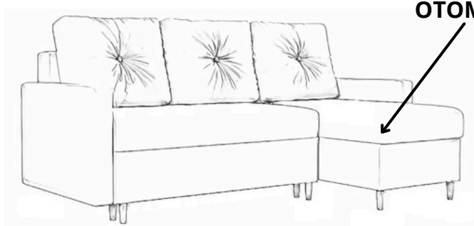
PRAWOSTRONNY (otomana z prawej strony)