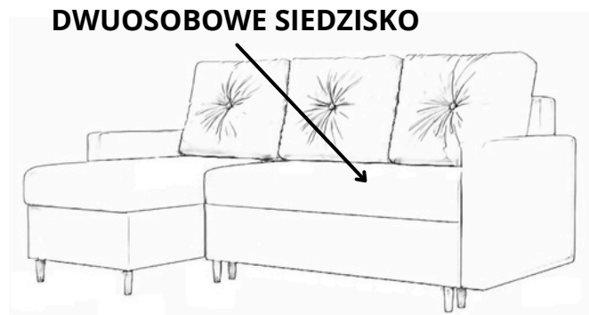
LEWOSTRONNY (otomana z lewej strony)