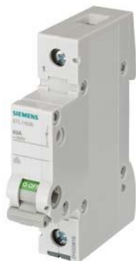
wyłącznik 40 A 1-biegunowy