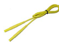
Przewód 1,2 m żółty 1 kV (2,5 mm 2 / wtyki bananowe)