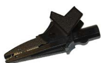
Krokodylek czarny 1 kV 20 A