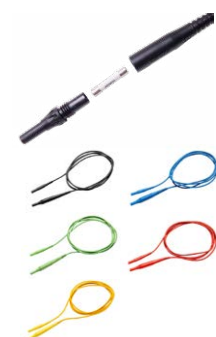
Przewód 2,0 m czarny / niebieski / zielony / czerwony / żółty CAT IV 1000 V (wtyki bananowe z bezpiecznikiem 10 A)

WAPRZ002BLBBF10 WAPRZ002BUBBF10 WAPRZ002GRBBF10 WAPRZ002REBBF10 WAPRZ002YEBBF10