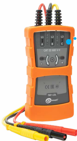
TKF-12L Tester kolejności faz