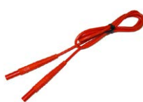
Przewód 1,2 m czer- wony 1 kV (2,5 mm 2 / wtyki bananowe)