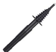
Sonda ostrzowa czarna 1 kV (gniazdo bananowe)