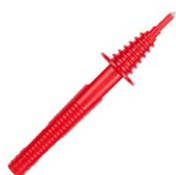
Sonda ostrzowa czerwona 1 kV (gniazdo bananowe)