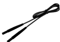
Przewód 1,2 m czar- ny 1 kV (2,5 mm 2 / wtyki bananowe)