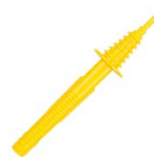
Sonda ostrzowa żółta 1 kV (gniazdo bananowe)