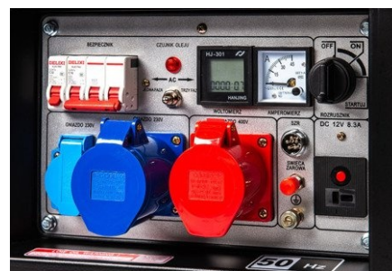
✔ Proton 360 (seria Plus, seria Oasis)