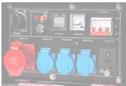
Proton 3 (seria Plus, seria Oasis)