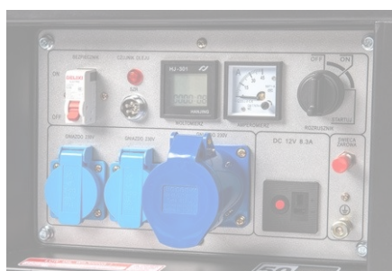
Proton 1 (seria Plus, seria Oasis)