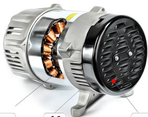
Zdjęcie pogładowe prądnicy

Korzystamy tylko i wyłącznie z podzespołów renomowanych firm, jedną z nich jest japoński lider w tej dziedzinie - NSK - dostarczający nam łożyska główne. Wszystkie silniki mają certyfikat CE, który jest zgodny z normami europejskimi.