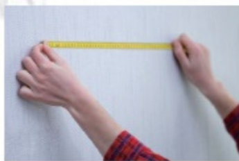
2. Zmierz wymagany rozmiar i zaznacz