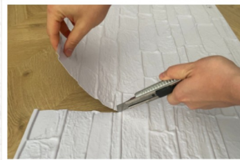
3. Dotnij panel ścienny wdg. własnych obliczeń za pomocą nożyka tapicerskiego