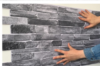
5. Wyrównaj krawędzie i układaj panele w kolejności