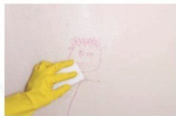
1. Wyczyść ścianę i utrzyj ją w suchości