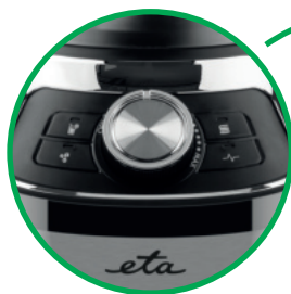
Płynna regulacja prędkości w zakresie od 10 000 do 16 000 obrotów na minutę oraz funkcja PULSE