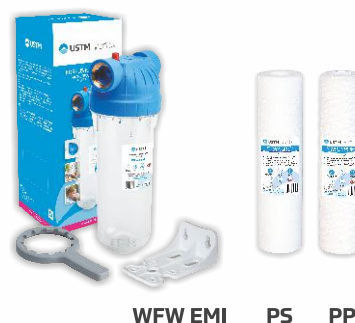
WFW EMI PS PP

Dla zabezpieczenia zmiękczacza przed zanieczyszczeniami z instalacji wodnej zalecamy instalację filtra wstępnego z serii WFW EMI wraz z wkładem mechanicznym piankowym z serii PS bądź sznurkowym z serii PP . Korpusy narurowe oferowane są z płytką montażową i kluczem, wyposażone w odpowietrznik i mosiężne wtopki. Do wyboru trzy średnice przyłącza: 1/2", 3/4", 1".