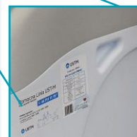
uchwyty do przenoszenia zmiękczacza