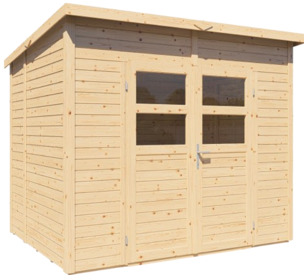
Zdjęcie przedstawia budynek niemalowany

Stale poprawiamy jakość naszych produktów, dlatego czasami komponenty mogą różnić się nieznacznie od tych przedstawionych i są poprawne tylko w momencie druku. Zastrzegamy sobie prawo do zmiany specyfikacji naszych produktów bez wcześniejszego powiadomienia. Podane wymiary są orientacyjne.