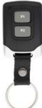
SLAVE = BIORCA