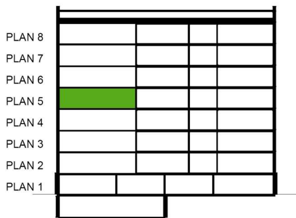
SEKTION SKALA 1:500