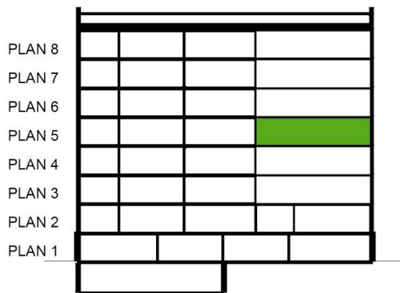
SEKTION SKALA 1:500