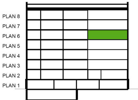
SEKTION SKALA 1:500