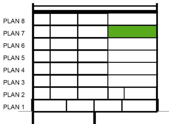
SEKTION SKALA 1:500