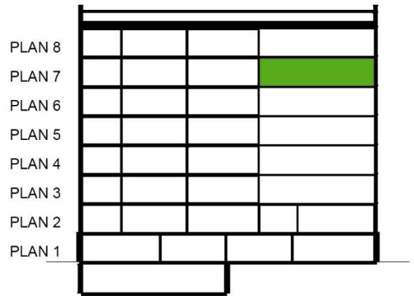
SEKTION SKALA 1:500