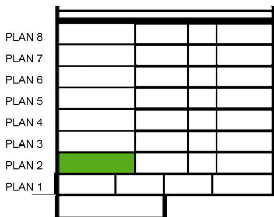
SEKTION SKALA 1:500