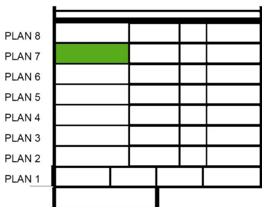
SEKTION SKALA 1:500