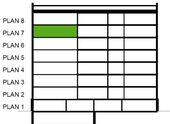
SEKTION SKALA 1:500