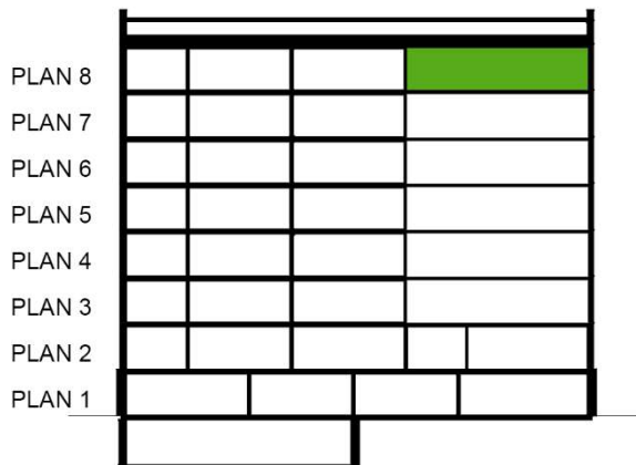
SEKTION SKALA 1:500