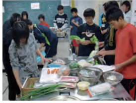
協力して手際よく作りました。

生徒は隠岐開発総合センターに宿泊し、炊事・洗濯・掃除など身の回りのことを自分達で行い、職場体験先へ通うという生活を送りました。