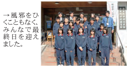
ひく、最えをなで迎。邪もなを。風とこん日た。→くみ終ま

今回の事業には、島根大学教育学部から4年生4名が来てくださり、午前中は海士中学校で学習支援等を、夕方から朝にかけては生活学校で生活指導等をしていただきました。