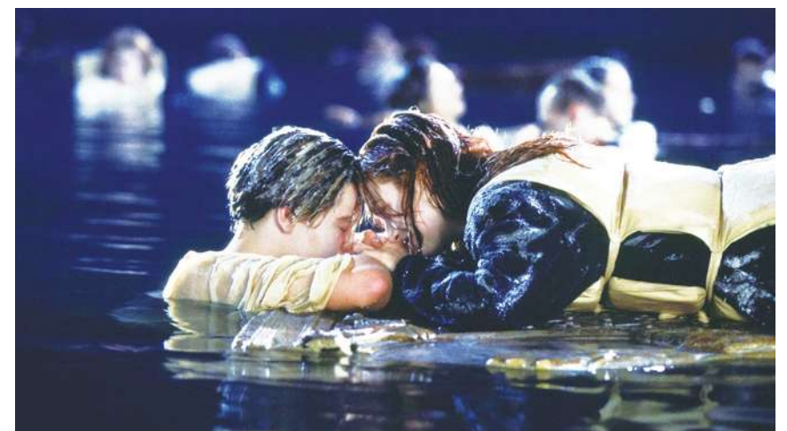
▲電影《鐵達尼號》的救命門板近日以 71 萬美元的高價拍出，該板子能否承載男女主角也成為電影熱議話題。(電影劇照)