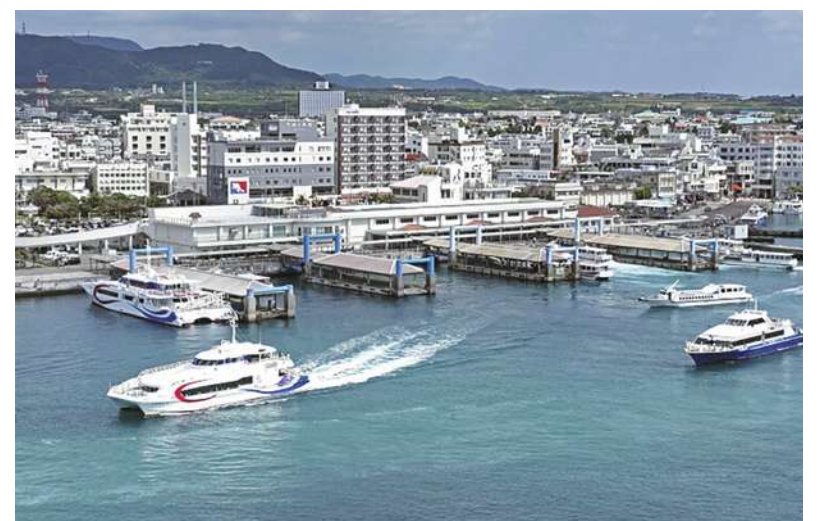
▲日本政府計劃指定 5 座機場與 11 座港口為「特定使用機場·港口」，並展開整建作業以強化防衛力，其中位在台灣附近的 2 座設施是沖繩縣內的石垣港與那霸機場。