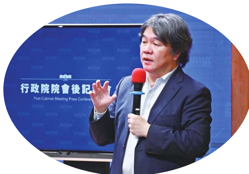
▲ 衛福部次長王必勝 28 日表示，會協助台北市政府檢驗與跨部會因應寶林食安事件。

他列舉說，寶林茶室是疑似食物中毒、小林紅麴案是國外的輸入原料，而蘇丹紅是廠商蓄意規避食藥署的邊境查驗，這些事情政府都會個別檢討，若有需要的話也可以綜合檢討。