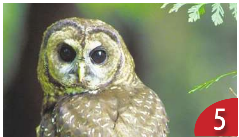
人工智慧聽懂鳥聲 可分析棲地