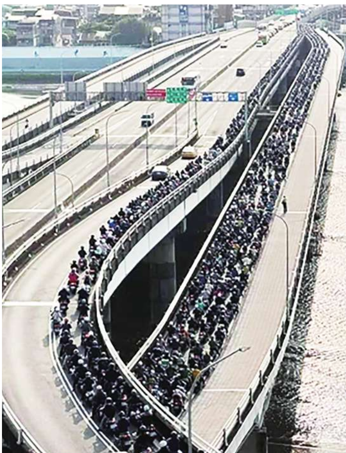
▲新北市橋樑機車專用道堵車超越一公里(影片截圖)

一般都知道台北忠孝橋、民權橋的機車大隊奇景導因在汽機車分流，因為分流，照片中看到的是車道完全淨空，機車道則堵車近一公里。事實上，連分隔島都可以劃分調撥範圍，一個小小的防護盾、如紐澤西護欄分道都沒有的泥板，會成為調撥分流的阻礙嗎？