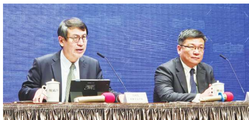
▲ 經濟部次長曾文生 28 日表示，政府漲電價已有多方考量，盼在野黨三思。

行政院發言人林子倫表示，政府已經針對各產業的影響進行評估，希望各界能夠支持相關方案。但記者持續追問，由於藍白在國會席次超過半數，若通過相關提案，台電是否會