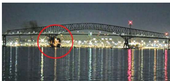
▲▲美國馬里蘭州巴爾的摩的摩市凱伊橋26日凌晨遭貨輪撞斷，橋上6名維修工人失蹤。