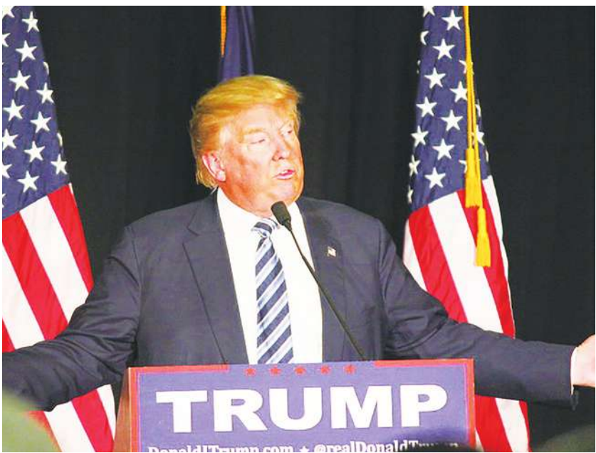
▲川普對於提倡閱讀聖經的看法，引起正反兩極意見。

本月稍早，皮尤研究中心公布調查結果也指出，多數對川普持正面看法的人，並不認為他是個虔誠的信徒，但認為他會支持跟自己相同宗教信仰的人。