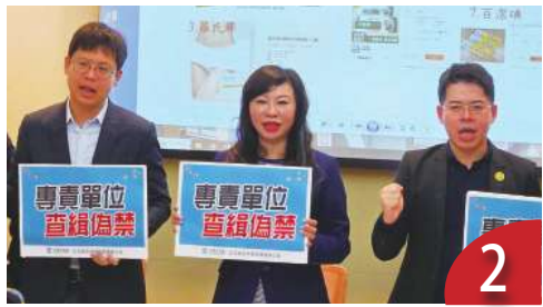
偽、禁藥汙濫 籲成立專責查緝