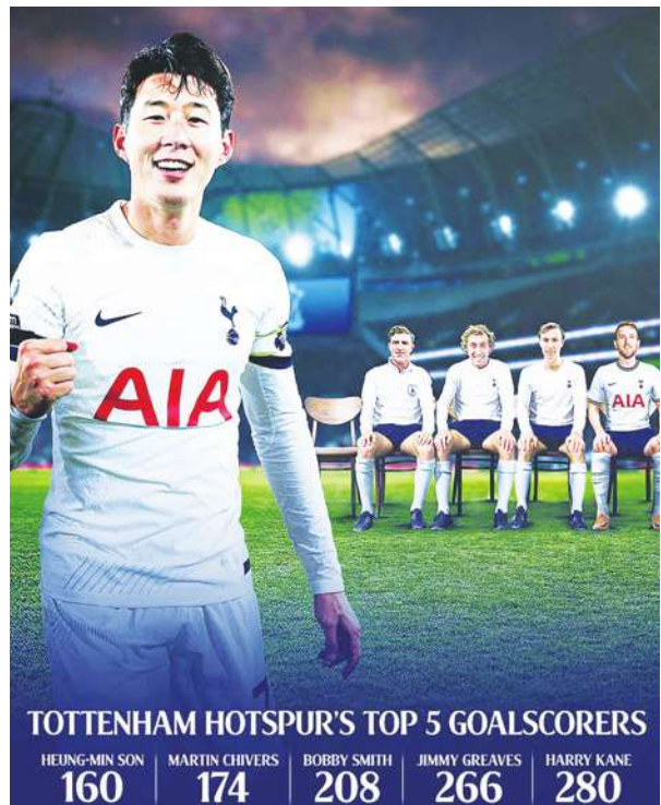
▲ 南韓一哥孫興慜踢進逆轉球，同時是個人熱刺生涯第 160 球，超車前輩瓊斯，獨居熱刺隊史射手榜第 5 名。

此外，孫興慜也推高亞洲球員在五大聯賽的進球紀錄（英超與德甲加總聯賽 159 球），遙遙領先第二名的前輩車範根（98 球）；至於亞洲選手的五大聯賽出場紀錄也穩居第一，目前排名第二的是日本不老傳奇長谷部誠（40 歲、382 場聯賽出賽），孫興慜德甲與英超加總已累積 429 場，仍處於實力巔峰的南韓、熱刺雙料隊長將繼續撰寫「孫哥障礙」。