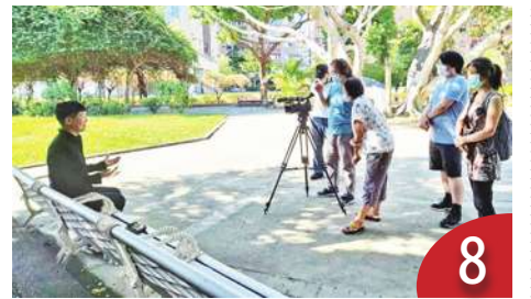
8 文學筆法下的眷村記憶 (藍祖蔚)