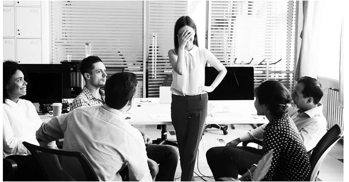
◀我是陷入困境的內向者，但並非因為我是內向者而陷入困境。

我是羞怯的，因為我害怕和陌生人接觸，也怕成為矚目的焦點，在和人群相處過後需要時間恢復元氣，而且我討厭很多人的場合。正如有一篇文章定義的，我是「有社