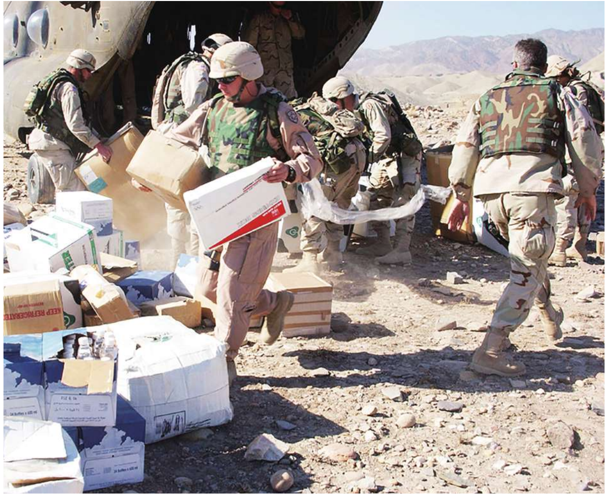
▲以色列雖然願意坐上談判桌，但仍不願開放加薩邊境，空投物資仍難緩解加薩走廊內的人道危機。

聯合國提及，加薩有 230 多萬人正處於人道危機，空投物資無法舒緩當地飢荒、缺乏物資、公衛資源與乾淨飲用水的困境。