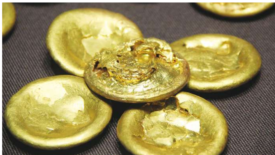
▲黃金風險極低，被許多投資者視為市場風險對沖的避險資產，隨著地緣風險加劇，黃金每盎司也於 3 月衝破 2100 美元。

65% 以上，印度也盼能搶下該寡占市場，印度煉金企業「CGR Metalloys」執行長桑馬薩德瑞說，在老廠牌精煉廠的帶領下，印度煉金產業轉向更高效率，並建立更值得信賴的煉金品質，進一步讓印度成為黃金冶煉的全球中心。