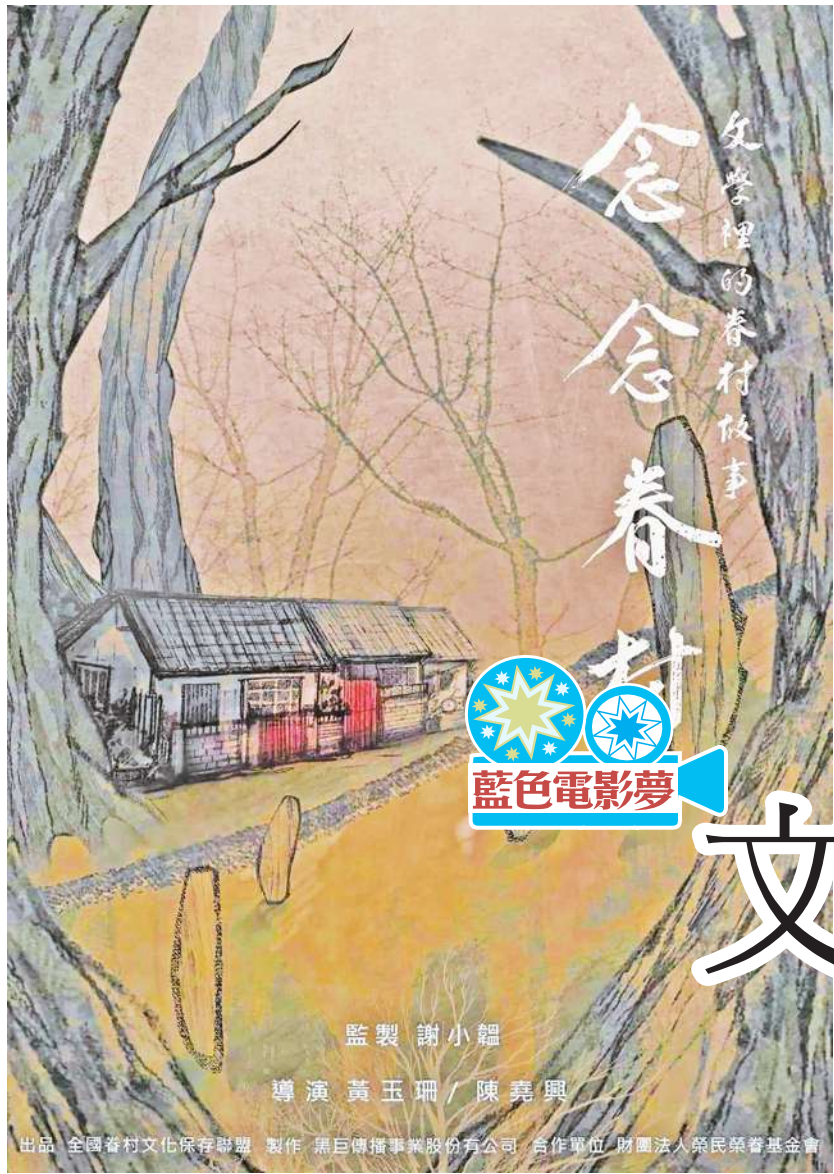
◀▶▶ 黃玉珊與陳堯興聯合執導的《念念眷村 - 文學裡的眷村故事》，試圖留住已經淡薄到比黑白老照片還蒼白的眷村往事。（作者提供）