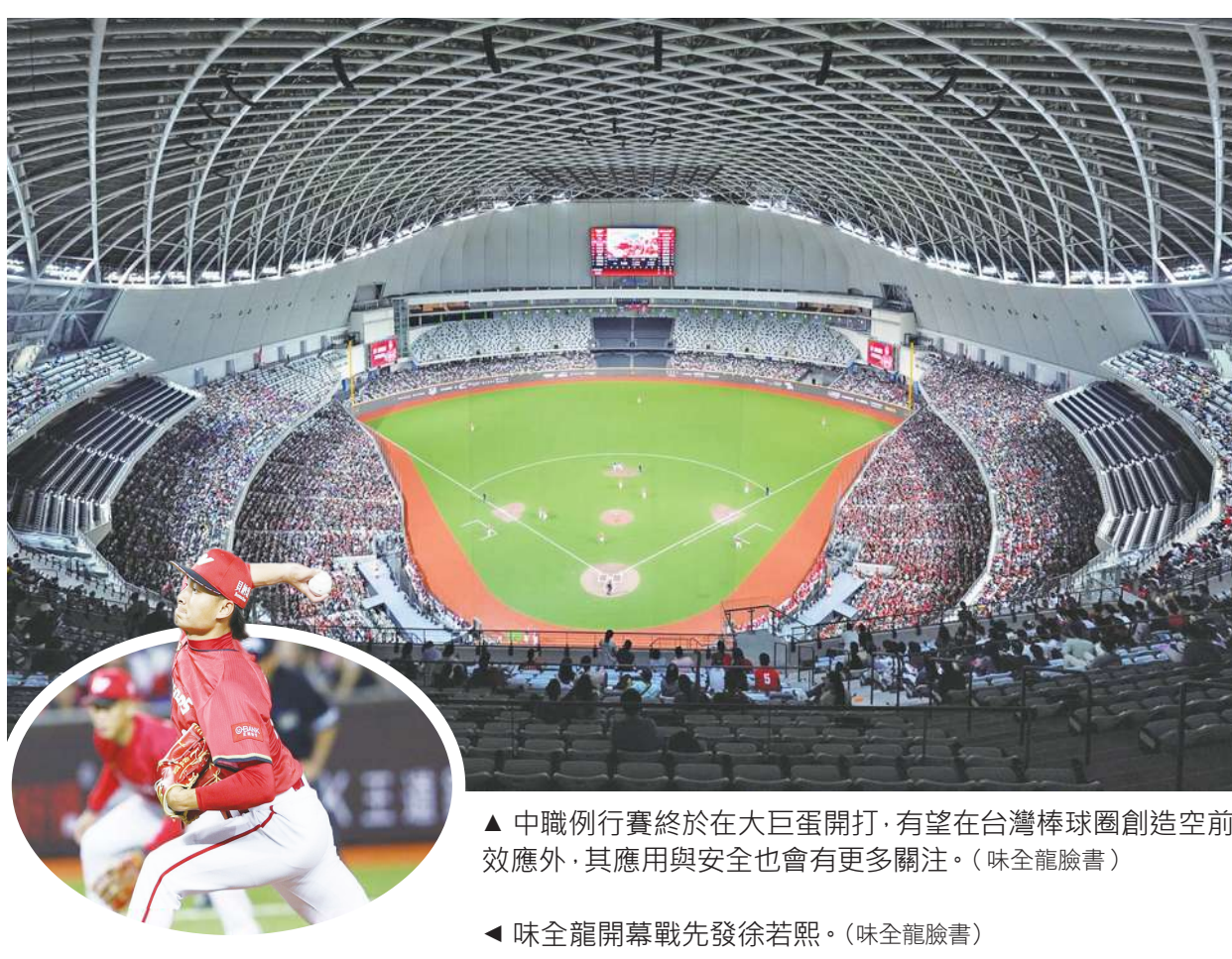
▲ 中職例行賽終於在大巨蛋開打，有望在台灣棒球圈創造空前效應外，其應用與安全也會有更多關注。

不過，目前大巨蛋用途較有限，主要以棒球賽事為主，目前雖有 T1 職籃聯盟將舉行例行賽，但籃球場在巨蛋中的安排仍有不少討論；此外，大巨蛋在開幕前也曾傳出警報誤響、屋頂漏水的狀況，加上興建的過程一波三折，外界勢必會拿著放大鏡檢視大巨蛋，是否能讓大量球迷都安全觀賽與退場。