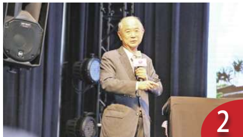
2 存亡之秋 胡為真新書還原台史