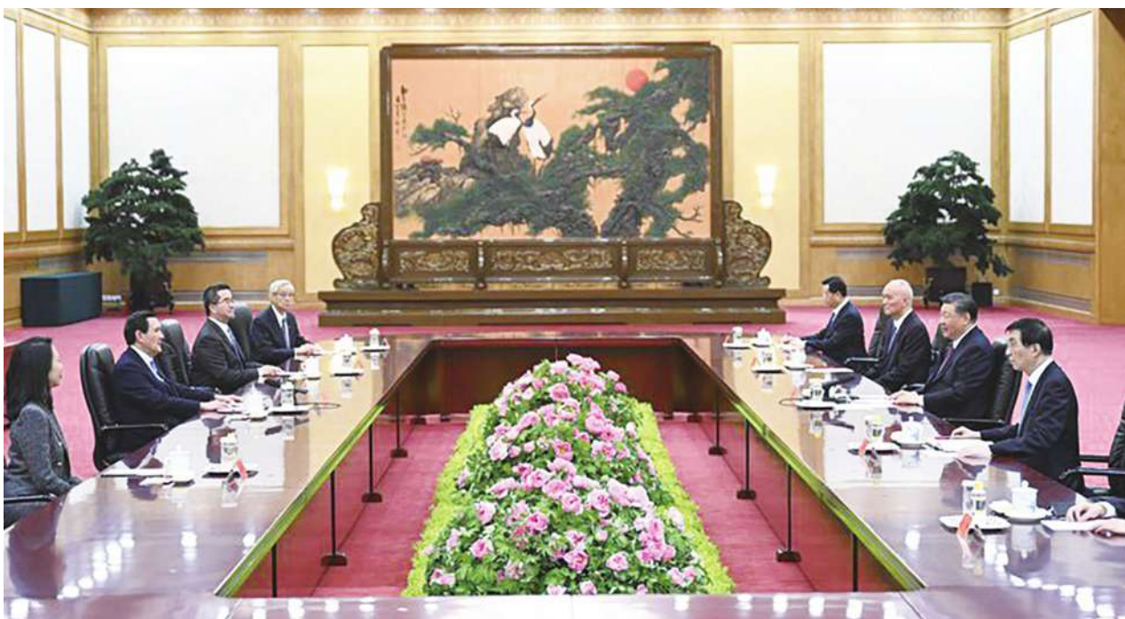
▲馬英九辦公室執行長蕭旭岑 11 日專訪時提到，習近平不只對馬英九，整體對台的感覺比想像中友善。

蕭旭岑：也會跟去年一樣，邀請中國同學回訪，去年是去湖南與武漢，今年沒有，所以邀請的對象也會不一樣，目前已經有邀請中山大學，後續若還有其他學校，也還在接洽中，預計 7 月邀請他們來看看台灣的風土民情。