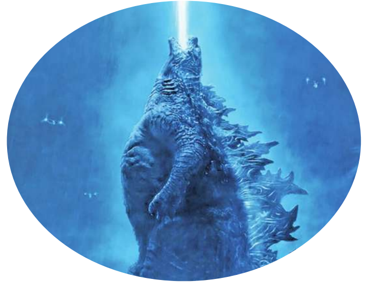
▲ 電影《哥吉拉-1-：怪獸之王》2019年上映，應用新興的電影技術，哥吉拉的震撼程度也飆升。(電影劇照)