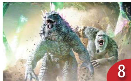
經典哥吉拉 橫掃全球票房