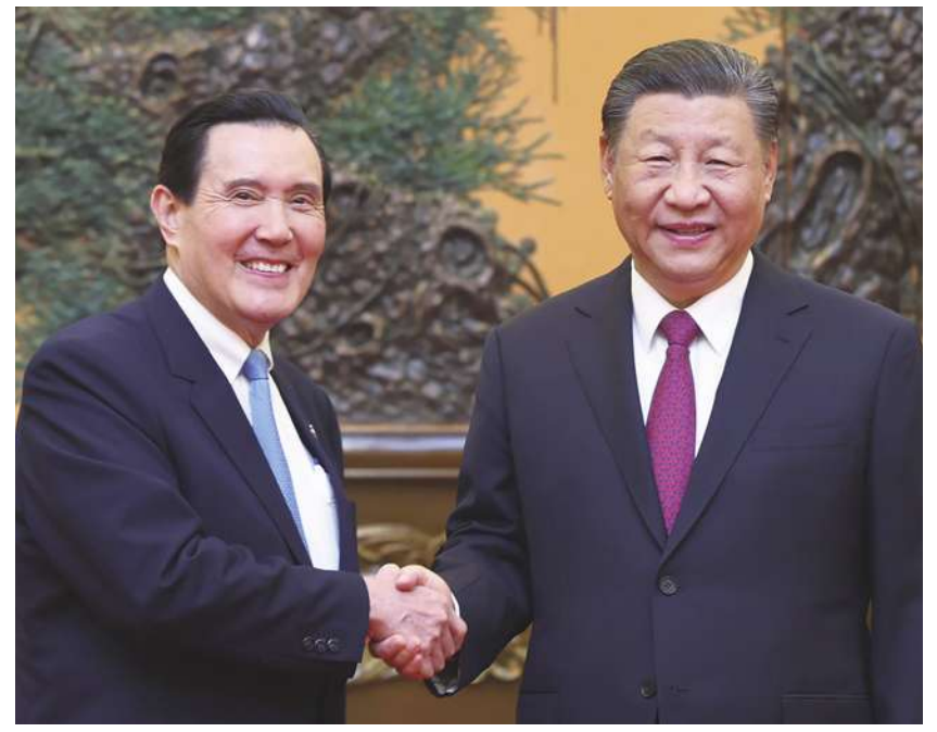
▲前總統馬英九（左）與中國國家主席習近平（右）10 日在北京大會堂見面，睽違 9 年兩人再次見面。