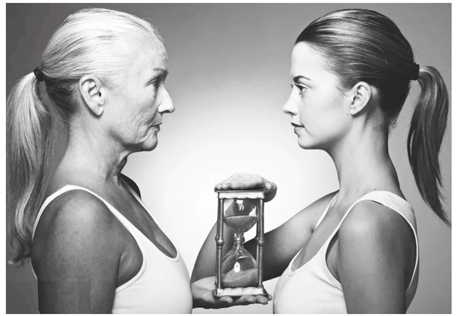
▲醫療在抗衰老方面扮演了較為被動的角色。(網路截圖)

運動算是政府政策當中相對較為積極的一環，而且其實政府在這方面的投入已經有多年的累積，從各縣市的運動中心，到定期舉辦的健走踏青活動，以及風景名勝和國家公園對長輩族群的優惠或免費開放，加上醫療院所和衛教機構定期舉辦的示範教學和免費講座，一再顯示政府早已認知到，運動有助於提升健康、延緩失能進而提升生活品質。