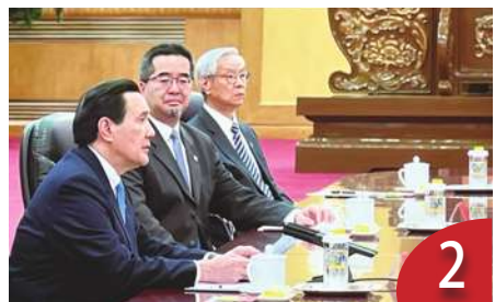
專訪蕭旭岑 馬習會見善意