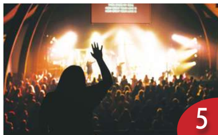
同唱《祢真偉大》新專輯