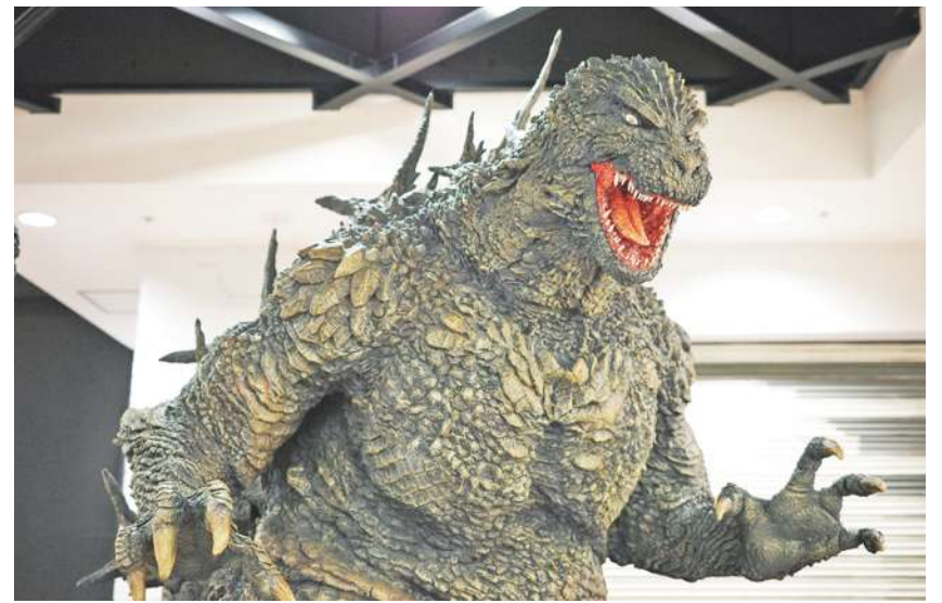
▲ 哥吉拉誕生至今70年，仍是所有影迷心中的「怪獸」經典。