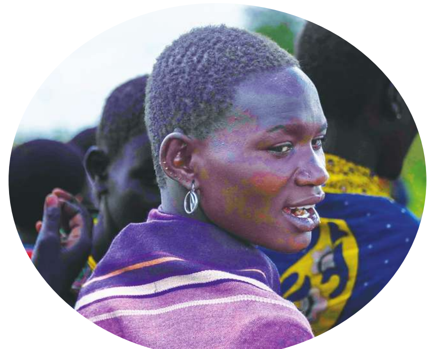
▲示意圖。過去也有許多非裔女性發起「自然頭髮運動」，盼非裔女避免美髮產品對人體造成的負面影響。