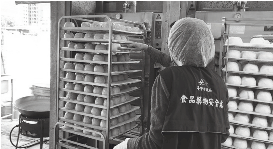
▲行政院長陳建仁11日特別交代衛福部，儘速就目前食安狀況進行檢討。圖為台北市食安處啟動中式炊蒸食品製造業及販賣業稽查專案

物中毒案件，盼衛福部啟動稽查與溯源，還要精進通報機制，評估是否增加輕症民眾的網路通報機制，掌握疑似個案資訊。他也要求衛福部，做好權責分工，協助地方政府查驗、檢驗等工作，釐清相關案件的影響範圍人數，同時檢討流程並提出改善方案。本報先前曾對衛福部次長王必勝詢問是否會有檢討方案時，王必勝曾回應說，