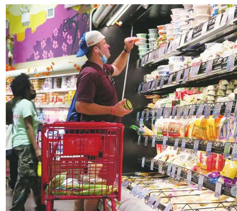
▲根據 11 日公布的會議紀要，美國聯邦準備理事會 (Fed) 在 3 月利率會議上對近期通膨「廣泛」上升表示擔憂，但仍表示預計今年將開始降息。