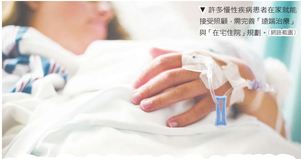
▼許多慢性病患者在家就能接受照顧，需完善「遠端治療」與「在宅住院」規劃。(網路截圖)

新興菸品攻入校園，近十萬青少年使用電子菸，加上18歲以下仍不能使用尼古丁貼片或戒菸藥物。醫生呼籲學生時期就應積極介入菸害防治，否則長大必成健康負擔，真令人憂心。(3版)