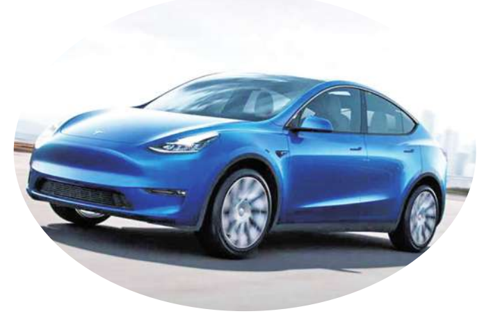
▲ 中國特斯拉全面降價。圖為 Model Y。(網路截圖)

● 日前特斯拉在中國市場宣布降價，中國電動車企理想汽車也宣布全面降價，價格戰方興未艾。理想汽車宣稱，4月22日起所有 2024 款理想 L7、L8、L9 及 MEGA 四種車系採用全新價格體系。理想本次降價後，L7 系列降人民幣 1.8 至 2 萬元，MEGA 從 55.98 萬元減至 52.98 萬元，減幅 3 萬元，至於新購戶及已購未交戶均享受新價格。同時也 2024 款已提车車主提供現金回饋。特斯拉中國方面也宣布，全面統一降價 1.4 萬元，售價較低車型減幅相對較大，像是 Model 3 從 24.59 萬降至 23.19 萬元，Model Y 降至 24.99 萬元起。Model S 降為 68.49 萬元起。Model X 降至 72.49 萬元起。