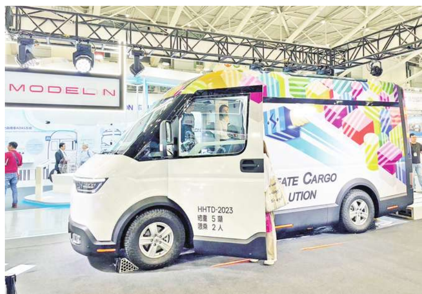
▲ 純電車已經上市近 15 年，充電樁的需求迫在眉睫。在美國若是獨立門戶住家，安裝只是自己問題。圖為鴻海參與國際車用電子展，展示電動車整車 Model B 以及電動物流車 Model N。