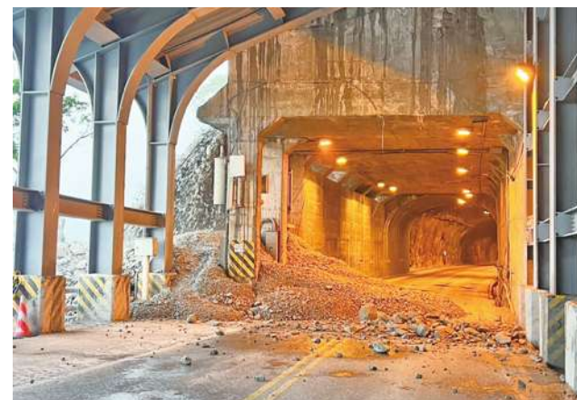
▲花蓮強震土石鬆動，22 日下午豪雨，蘇花公路台 9 丁線 6.9 公里處，造成道路阻斷，車輛無法通行。