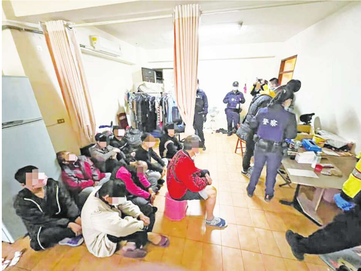
▲東南亞網路詐騙近年來愈來愈猖獗，緬甸因軍政府無力管轄，成為最多詐團群聚之地。

當害怕，擔心自己隨時失去性命。營地裡還有40名被擄者，有斯里蘭卡人、巴基斯坦、印度、孟加拉，甚至是非洲國家的人都有。由於緬甸軍政府疲於因應國內反抗軍，讓緬甸成