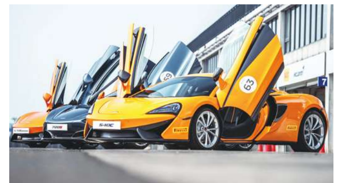
▲ 麥拉倫超跑車款再獲紅點設計大獎肯定。