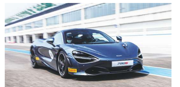
▲ 麥拉倫 720S 超跑外觀。

● 麥拉倫超跑在 2016 年正式啟動 Track 22 計畫，以 McLaren 720S 揭開序幕。當局採用建築名師路易斯·沙利文格言【Form follows Function】形式追隨功能的理念，透過頂尖空力設計與賽事科技，藉優雅流暢線條展現車身，讓英式超跑獨特品味煥發精神。而跟著 570S Coupé 後，麥拉倫 720S 獲獎無數好評中，日前再度奪下紅點設計大獎【Best of the Best】殊榮，以力與美交織新世代頂級超跑典範。