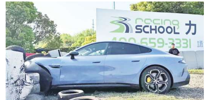
▲ 中國小米超跑 SU7 有車主上賽道，剎車來令片直接燒光撞。

● 中國小米超跑 SU7 有車主直接上賽道操演，上賽道，應該只是配個街道版來令片，但賽道才 5 圈半來令片就磨到精光，假設台灣高速公路沒跑完就直接剎車消失，會一來小米沒有標榜可以不會太可怕？