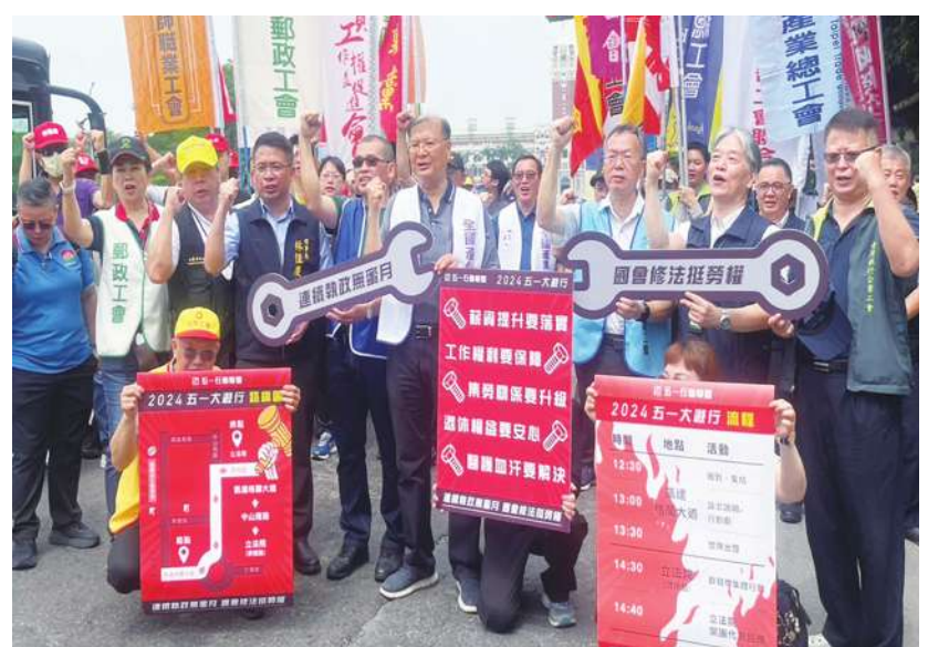
▲數十個工會與民團22日於凱道召開「五一遊行」的行前記者會，現場公會旗海飛揚，高喊「連續執政無蜜月，國會修法挺勞權」。

【本報記者簡嘉佑台北報導】「連續執政無蜜月，國會修法挺勞權！」數十個工會與民團22日於凱道召開「五一遊行」的行前記者會，現場工會旗海飛揚，一同提出加薪、保障工作權益等訴求。全國產業總工會理事長江建興表示，民進黨連續執政，應儘速兌現選前的勞工承諾。