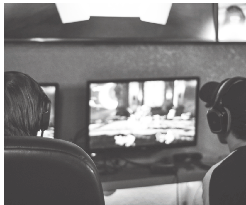
▲ 社群媒體可能對兒童及青少年的心理健康與幸福造成嚴重傷害。

同時，美國一所專注於媒體與內容安全議題的非營利組織「常識媒體(Common Sense Media)」則是在近期發表了一篇名為《二〇二四年美國兒