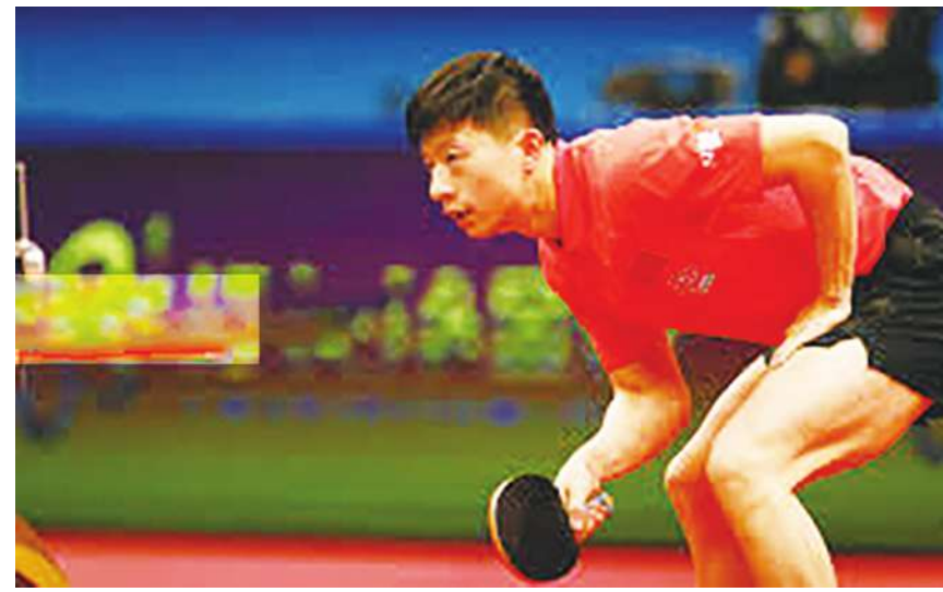
▲中國桌球老將馬龍又拿冠軍，生涯距離3大賽事3輪大滿貫，就差巴黎奧運了！

此外，澳門桌球世界盃的女單決賽也出現類似的精彩劇本，同為中國內戰，王曼昱的反拍表現出色，前4局拿下3：1聽牌，但孫穎莎穩定心態，以自己優勢的正手擰拉，不斷調動王曼昱的節奏，最終完成4：3的逆轉，生涯首奪桌球世界盃單打冠軍。