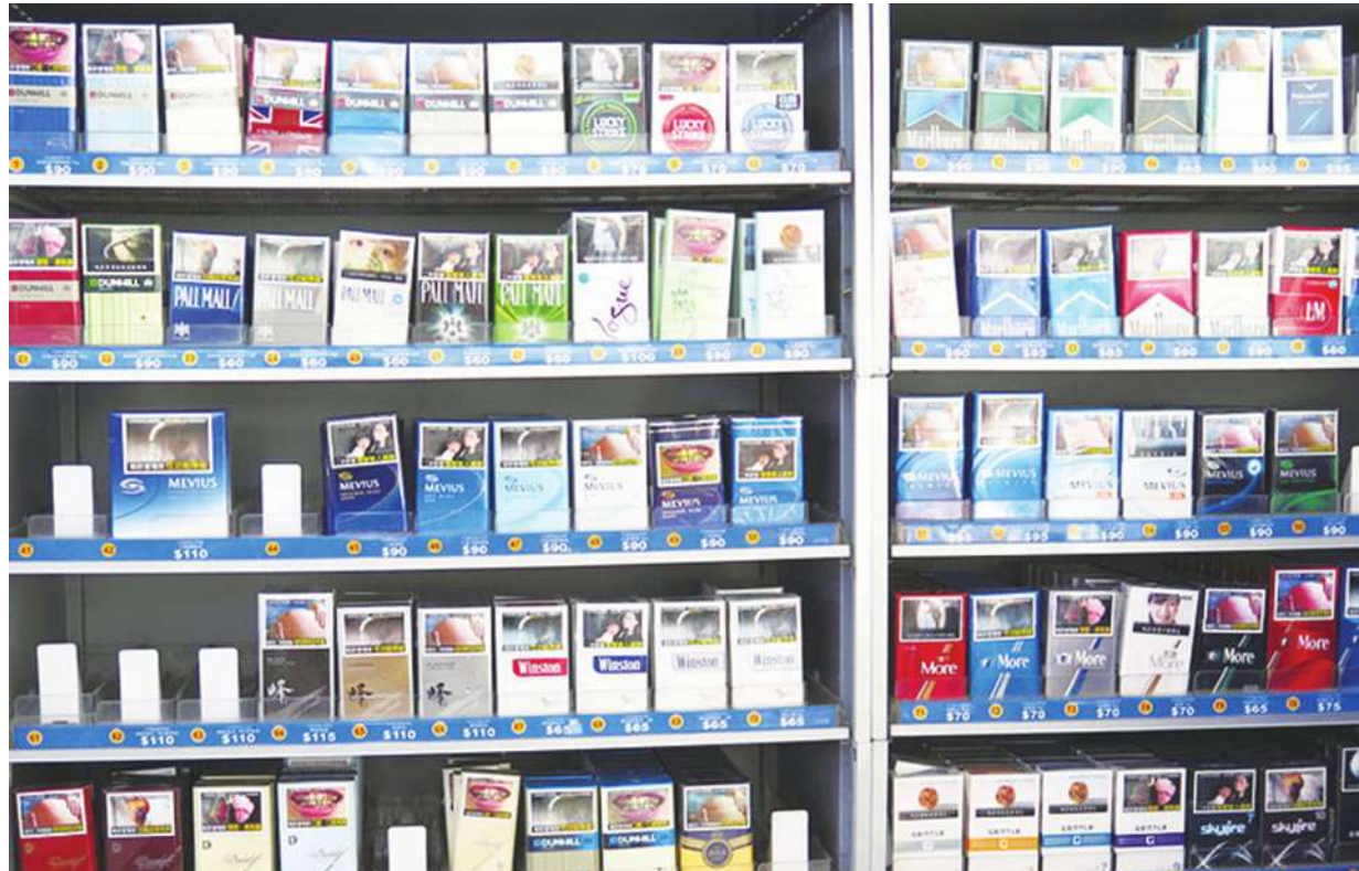
▲馬偕醫院胸腔內科主治醫師楊勝雄 22 日於記者會表呼籲，應在學生時期就應積極介入菸害防治。(本報資料照)

【本報記者簡嘉佑台北報導】新興菸品攻入校園，據推估，近十萬青少年使用新興菸品！馬偕醫院胸腔內科主治醫師楊勝雄 22 日於記者會表呼籲，應在學生時期就應積極介入菸害防治。馬偕紀念醫院胸腔內科醫師鍾心佩也指出，18 歲以下的民眾仍無法使用尼古丁贴片或戒菸藥物，呼籲青少年「從一開始就不要碰」。