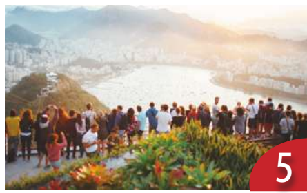
過度旅遊破壞生態 萬人抗議