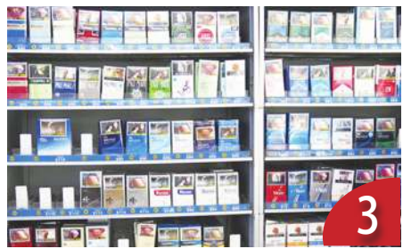
新興菸品 醫師：防治需趁早