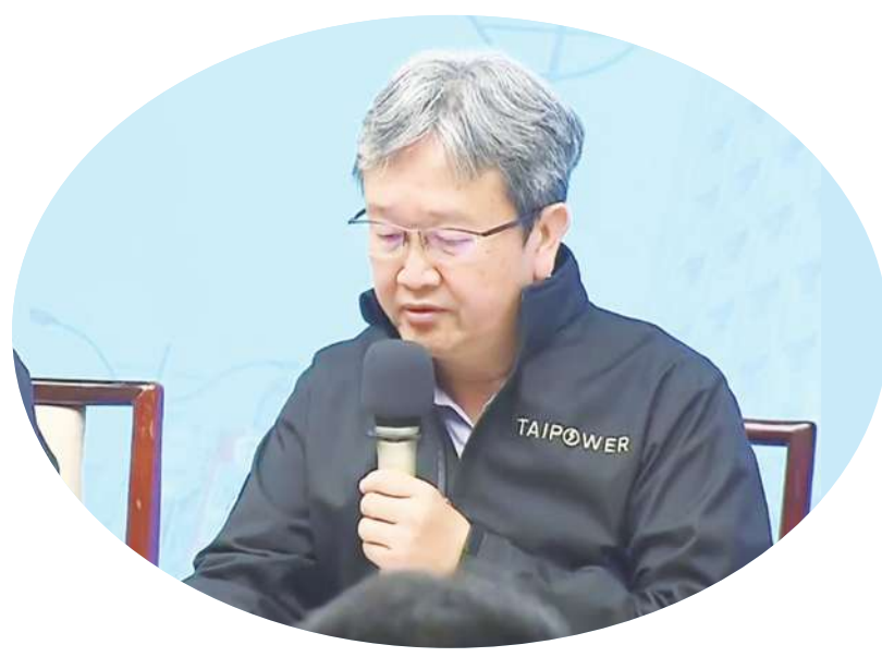
▲台電總經理王耀庭 22 日宣布接受慰留，批評國民黨將電力問題用政治解讀。(直播截圖)

【本報記者呂翔禾台北報導】「停電各有原因，卻被無限上綱成缺電，對台電同仁並不公平！」原定辭職的台電總經理王耀庭 22 日表示接受慰留，並持續為台電負責。他也批評在野黨將停電扭曲成缺電與能源政策錯誤，讓台電基層同仁受到無比政治壓力。對此，國民黨團回應說，執政者不要再隱身背後，賴清德總統上任應對外重新說明能源政策。