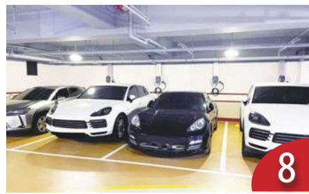
大樓裝充電樁 管委會頭痛