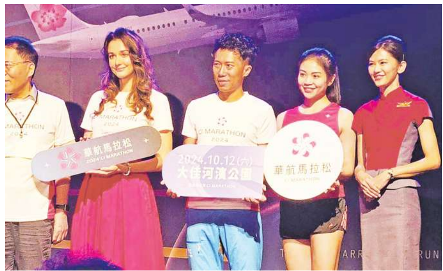
▲華航馬拉松將於 10 月 12 日開跑，即日起開始報名。