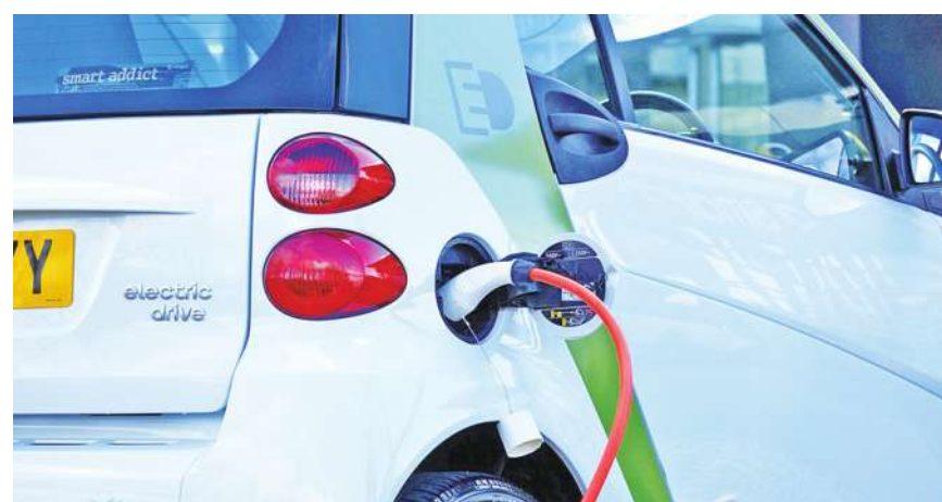
▲ 混電則有自有燃油引擎發電不需要充電樁與需要的差別，燃油車則與過去 150 年相同，讓加油站可以繼續存在。