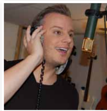
Magnus Carlsson är en av de artister som medverkar på Solrosens nya CD.