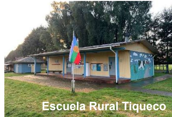
Escuela Rural Tiqueco