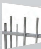
→ EXALT® DELTA