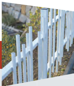
Barreaux en applique