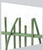
→ EXALT® NATURA