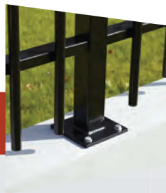
Poteau sur platine invisible