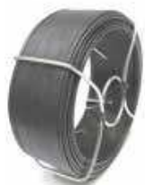
Bobinots plastifiés ou galvanisés