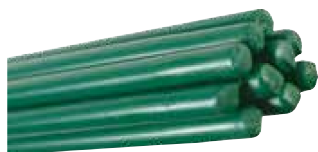
Barres de tension plastifiées ou galvanisées