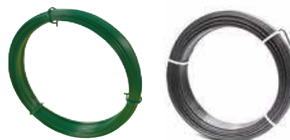
Fils d'attache plastifiés ou galvanisés