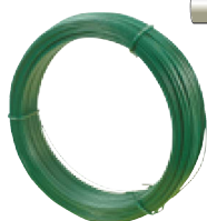
Fils de tension plastifiés ou galvanisés