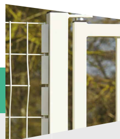
Départ clôture (option)