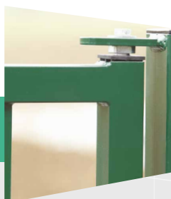
Gond du portail