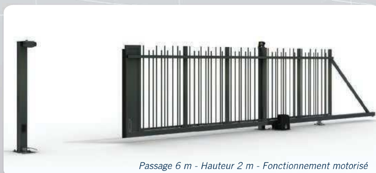
Passage 6 m - Hauteur 2 m - Fonctionnement motorisé