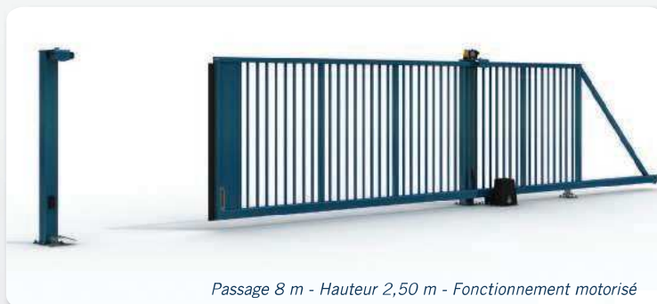
Passage 8 m - Hauteur 2,50 m - Fonctionnement motorisé