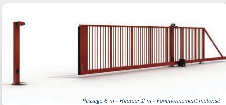
Passage 6 m - Hauteur 2 m - Fonctionnement motorisé