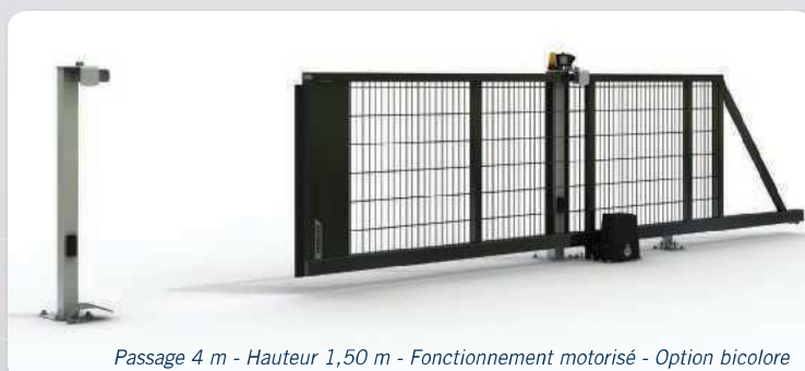
Passage 4 m - Hauteur 1,50 m - Fonctionnement motorisé - Option bicolore