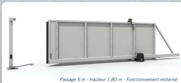
Passage 5 m - Hauteur 1,80 m - Fonctionnement motorisé