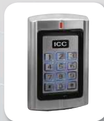
Digicode/lecteur de proximité