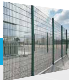
Système d'accroche simple