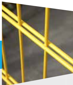
Doubles fils horizontaux de \varnothing 6 mm