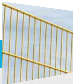
Panneau plat sans découpe