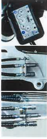
Circuit hydraulique auxiliaire (AUX1) sur le balancier

Tout le monde voudrait ajouter une fonctionnalité particulière ou donner une touche personnelle à sa machine. Faites votre choix dans la longue liste d'options disponibles et personnalisez votre pelle compacte selon vos besoins.