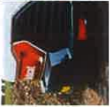
Barre d'éclairage à LED