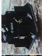
Plaque de compactage