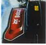
Pompe à carburant électrique