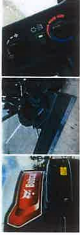
Circuit hydr. auxiliaire (AUX2). Ecran de 7" pouces avec conduite de vidange