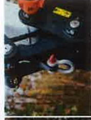
Attache à verrouillage sur axe