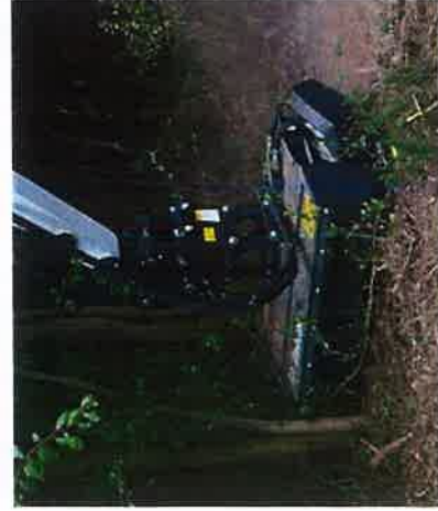
Tondeuse à fileaux