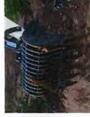
Godets à claire-voie