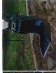
Godets à glaise