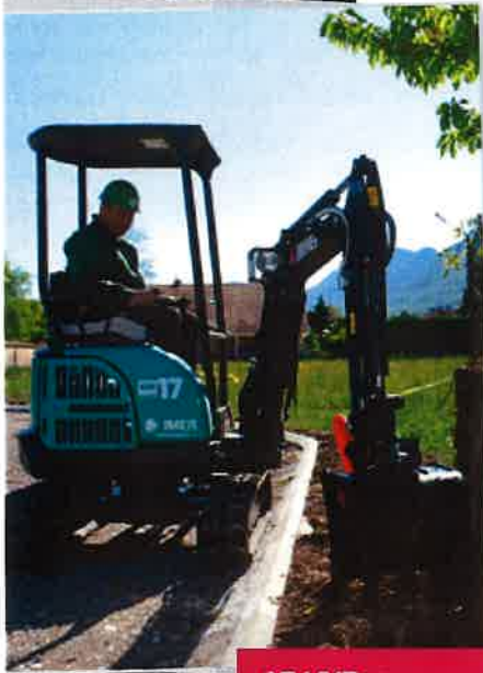
17 VXE Modèle ultra-compact

Modèle ultra-compact. Puissance et rapidité de creusage sont assurées pour tous les travaux effectués dans des espaces restreints : travaux de fouilles, dans les tunnels où d'autres machines ne peuvent accéder, mais aussi dans le secteur du jardinage et du paysagisme.