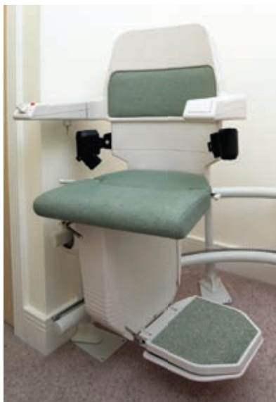
Siège pivotant pour quitter le siège en toute sécurité. (Pivot motorisé en option)