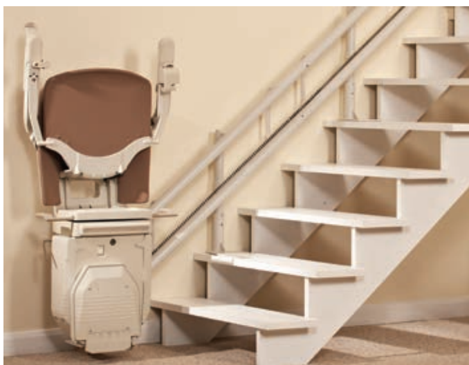
Le monte escalier peut être replié pour faciliter l'usage de l'escalier aux autres membres de la maison

Le VIRAGE n'est proposé que par des professionnels régionaux reconnus. Parce que l'achat d'un monte-escalier c'est important et qu'il est primordial de pouvoir compter sur un service irréprochable.