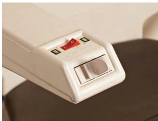
Commandes ergonomiques sur l'accoudoir afin de faciliter vos déplacements.