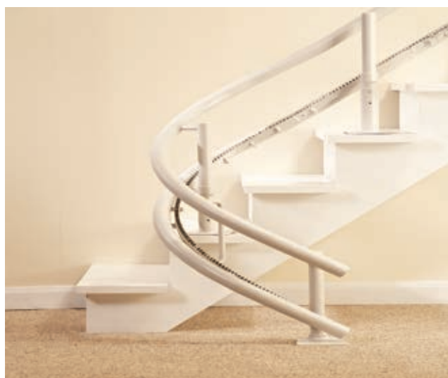
Le rail double peut être installé de chaque côté de l'escalier.