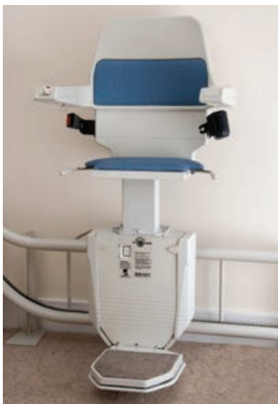
Siège perche en option pour escalier étroit ou utilisateurs de grandes taille.