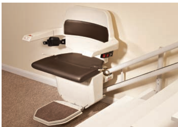
Le double rail vous assure un déplacement silencieux, en douceur et sans aucun à-coup.