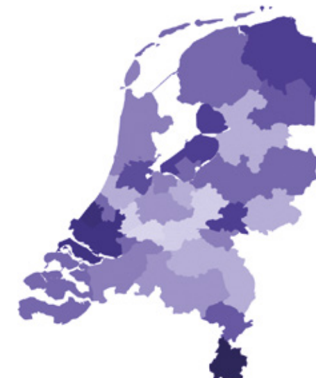
Figuur 1 Percentages NEET-jongeren per arbeidsmarktregio. Hoe donkerder de regio, hoe hoger het percentage.

Uit figuur 2 blijkt tevens dat jongeren met een achtergrond in praktijkonderwijs 4,4 keer meer kans hebben om NEET te worden dan jongeren die een andere achtergrond hebben. Ook voortijdig schoolverlaten (VSV), speciaal onderwijs en mbo niveau 1 geven een relatief hogere kans op NEET.