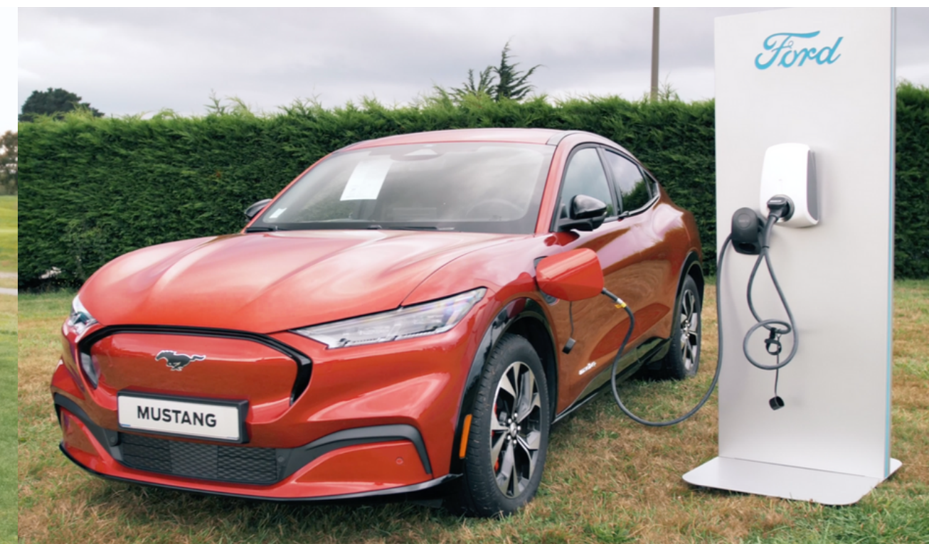
FORD Mustang Mach-e