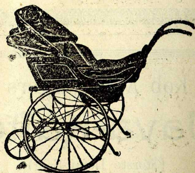
Barnevogne og Legevogne i største Udvalg her paa Pladsen. Aarhus Barnevogns-Magasin, Volden 4.

Denne »nye« Parisermode er imidlertid kun en Genganger fra gamle Dage. Vore Bedstefædre brugte i 1850 ogsaa haandbroderede Veste, og endnu eksisterer der sikkert mange smukke Eks-