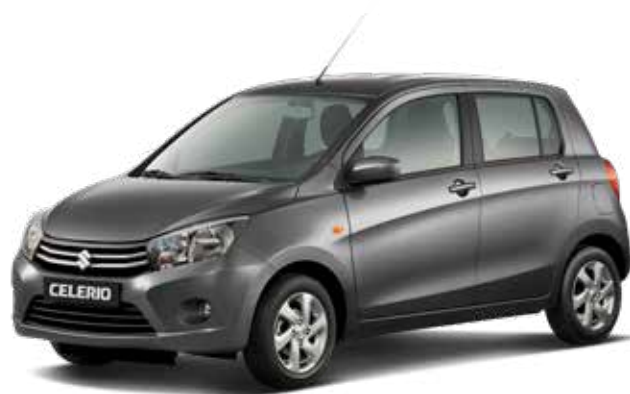
Mineral Gray Metallic 2 (ZTU) – Optie