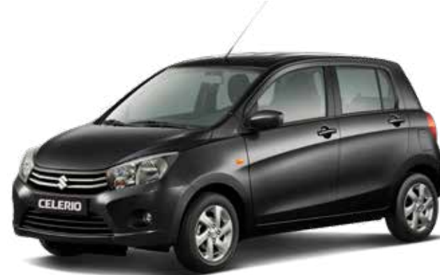
Super Black Pearl Metallic 2 (ZTT) – Optie

Kleuren kunnen onder invloed van het drukprocedé afwijken van de werkelijkheid.