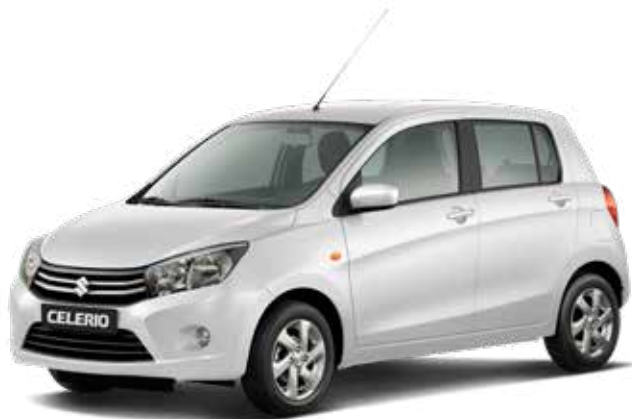
Superior White 2 (ZQH) – Standaard

De kleur van een auto is heel persoonlijk. Daarom is de Suzuki Celerio leverbaar in 6 verschillende kleuren. Vind je het lastig om een goede kleur te kiezen? Kom dan langs in de showroom om de kleuren eens in het echt te bekijken, voordat je een beslissing neemt.