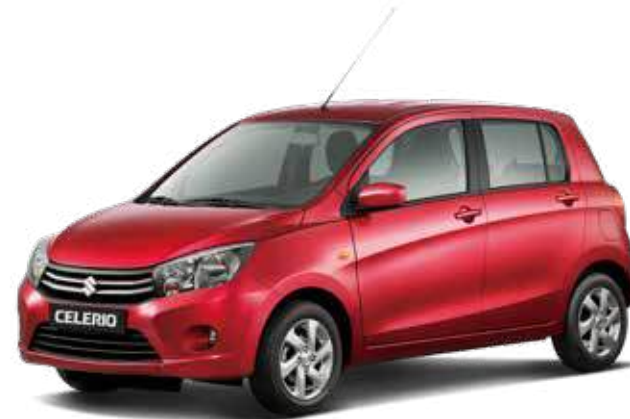
Alblaze Red Pearl Metallic 3 (ZTW) – Optie