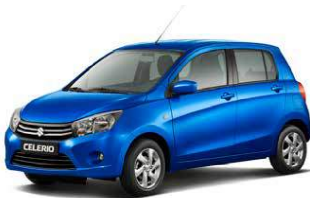
Speedy Blue Metallic (ZYH) – Optie