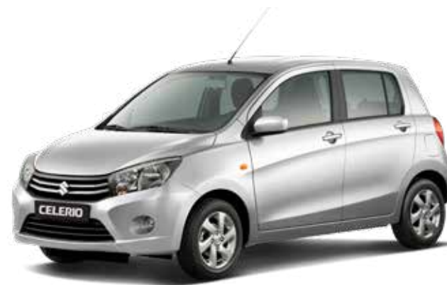
Star Silver Metallic 4 (ZTS) – Optie