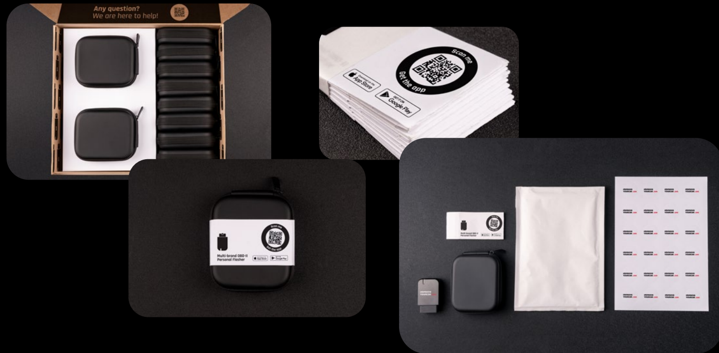
Anteprima della personalizzazione di un pacchetto da 100 unità