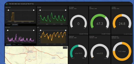
עיריית מודיעין מכבים רעות - אתר נתוני מזג אויר לציבור

מערכת ArcGIS של ESRI מיועדת עבור כל מחלקות הרשות. את המסע לעיר חכמה יכולה להתחיל כל רשות ממחלקה שונה. אנו בסיסטמטיקס הכנו עבור הרשויות תפריט יישומים חכמים. כל הדוגמאות בתפריט זה כבר יושמו בהצלחה ברשויות שונות בארץ. הפתרון מאפשר ביצוע התאמות לרשות, אך לא דורש פיתוח או ידע בפיתוח.