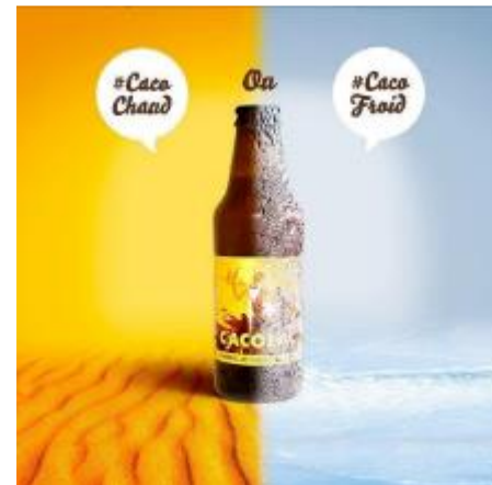
Sea and mountain