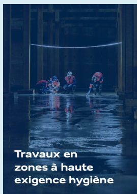
Travaux en zones à haute exigence hygiène

Intervention dans les zones de production sensibles