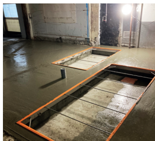
Scellement de process dans l'existant