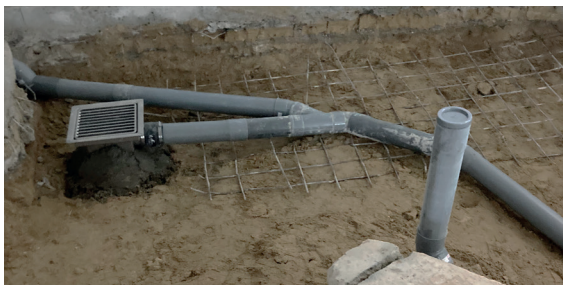
Réfection réseau d'évacuation aux normes