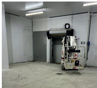
Réfection de sol