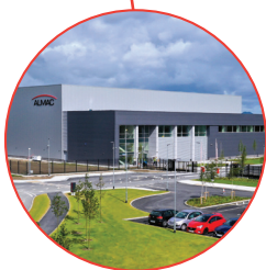
欧州本社 ダンドーク アイルランド