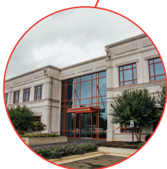
米国 オペレーション施設 ダーラム ノースカロライナ州