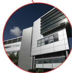
グローバル本社 クレイガヴォン 英国