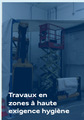
Travaux en zones à haute exigence hygiène

Intervention dans les zones de production sensibles