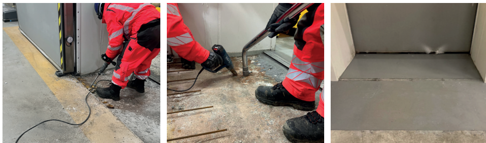
Réparation seuil congélateur -20°C