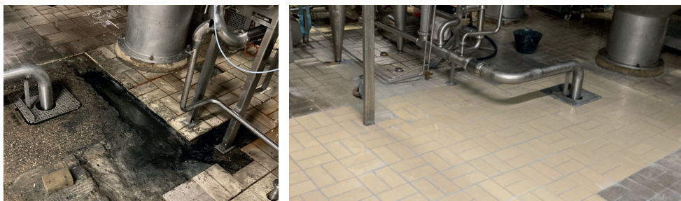
Réparation carrelage agro-alimentaire