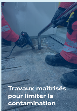
Travaux maîtrisés pour limiter la contamination

Travaux en chambre froide (0 à 5 °C) et en congélateur (jusqu'à -25 °C)