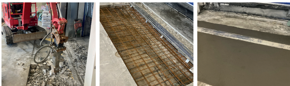
Réparation seuil chambre froide entre 0 et 4°C