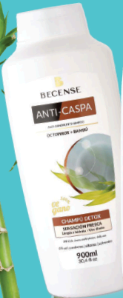
CHAMPÚ 900ML 20-5 EAN 7898971146123

Proporciona limpieza profunda y sensación de frescura, dejando el cabello limpio y saludable.