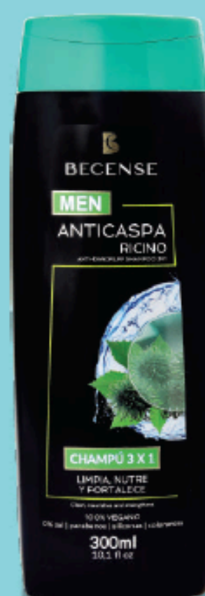
CHAMPÚ 300ML 53-1 EAN 7898971146765