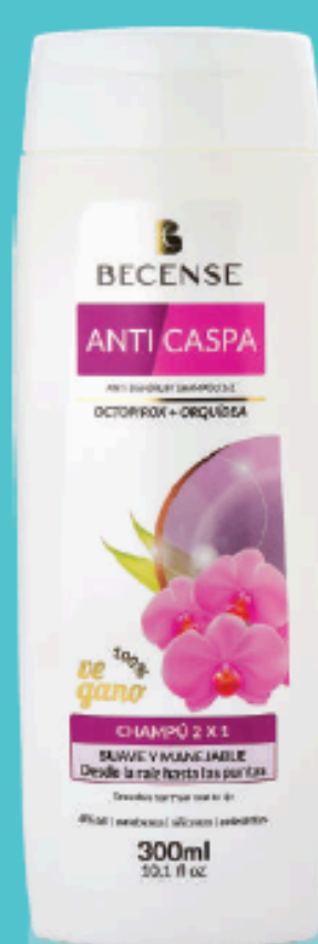
CHAMPÚ 300ML 51-5 EAN 7898971146741