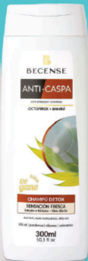
CHAMPÚ 300ML 21-3 EAN 7898971146116