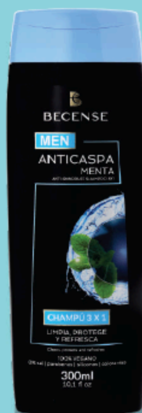
CHAMPÚ 300ML 52-3 EAN 7898971146758