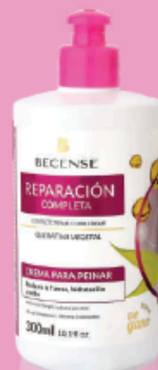
CREMA PEINAR 300ML EAN 7898971146246