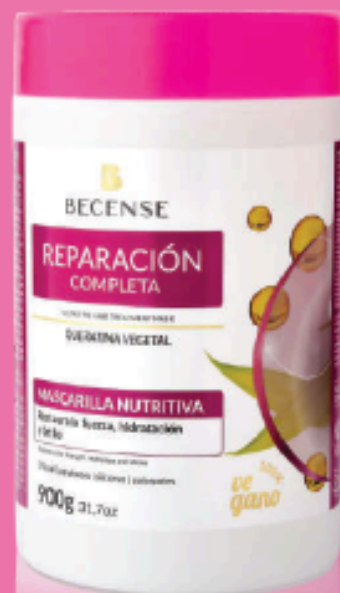
MASCARILLA NUTRIT. 900G EAN 7898971146321