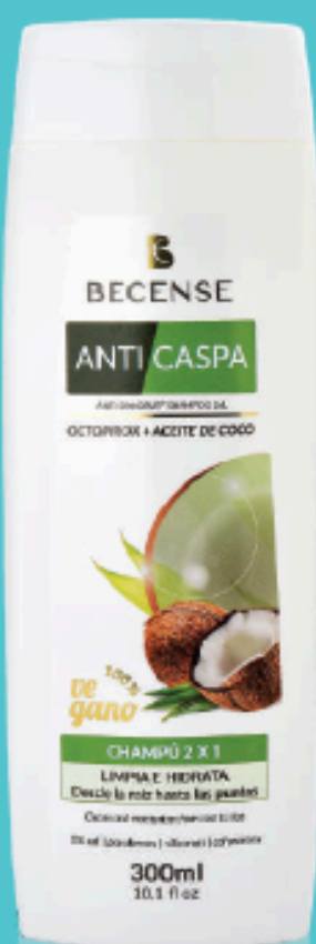
CHAMPÚ 300ML 50-7 EAN 7898971146734