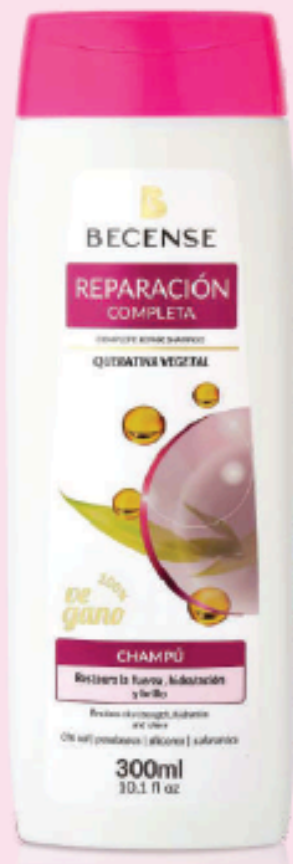
CHAMPÚ 300ML EAN 7898971146024

Actúa progresivamente con tratamientos, restaurando la fuerza y dejando el cabello más saludable, suave y con brillo, día tras día.