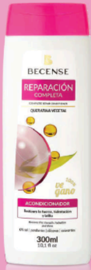
ACONDICIONADOR 300ML EAN 7898971146154