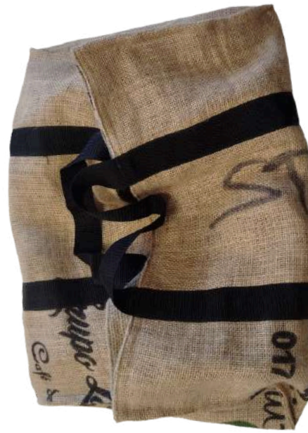
Sacs à buches