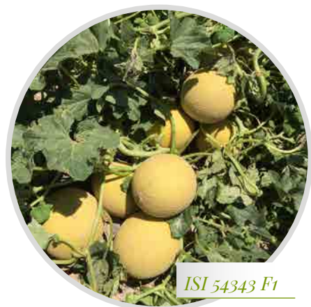
ISI 54343 F1

Variedad de galia semi larga vida, adaptada a plantaciones tempranas, alto nivel brix, buen color externo que facilita su recolección.