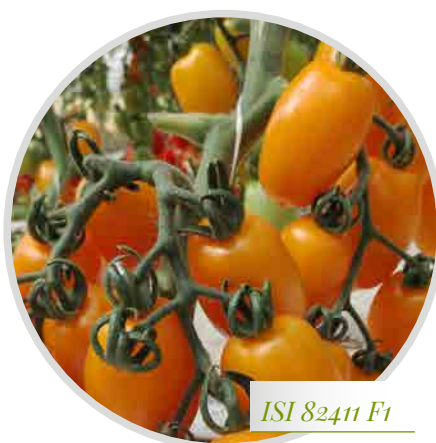
ISI 82411 F1