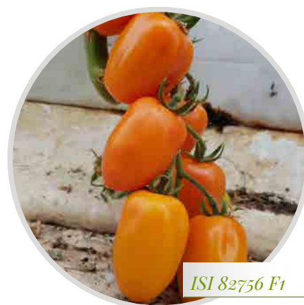
ISI 82756 F1