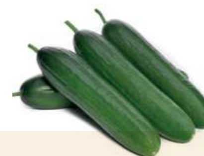
Bagatao BETA-ALPHA MINI