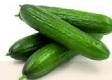
Boracay BETA-ALPHA MINI